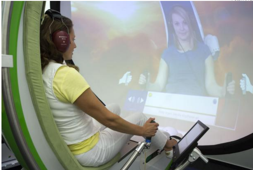
Im Präventiometer dauert der Check-up nur eine Stunde. Ein Arzt ist aber immer noch dabei